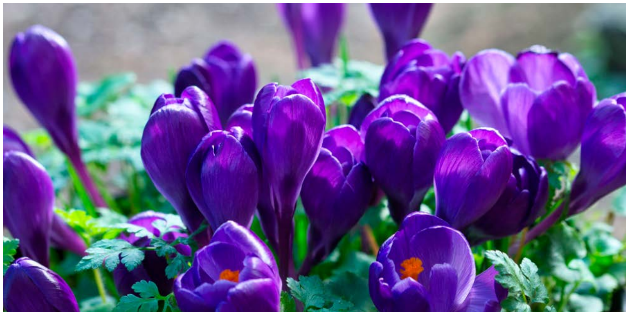
Alison Day, Purple crocuses.