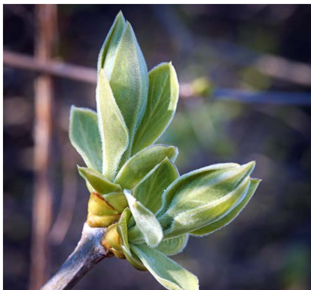
Flickr CC, Hedera baltica , spring at last.