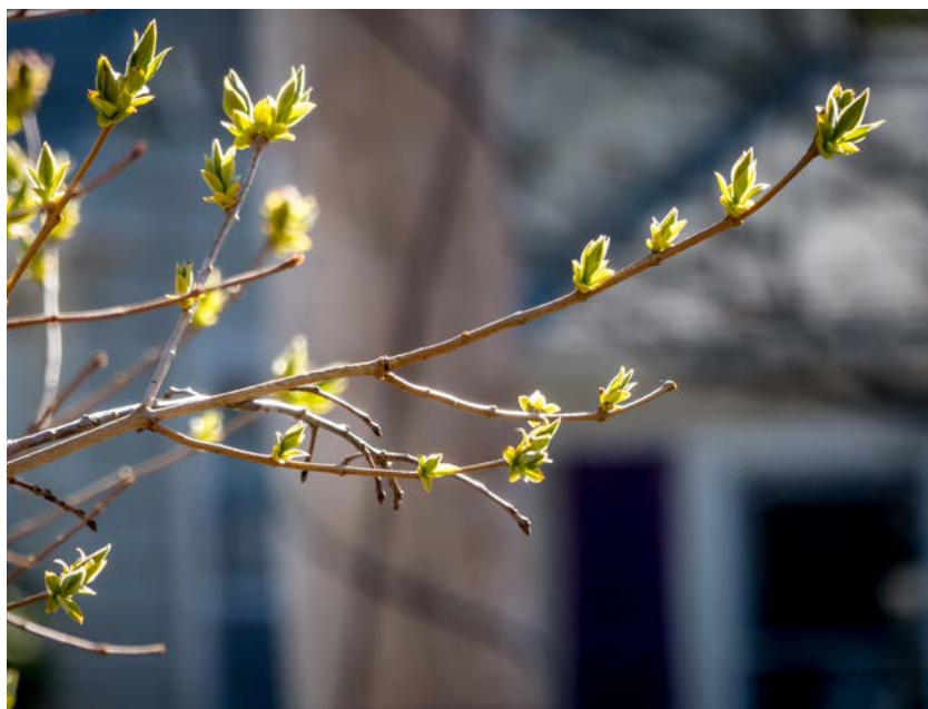
Winhide, Spring .